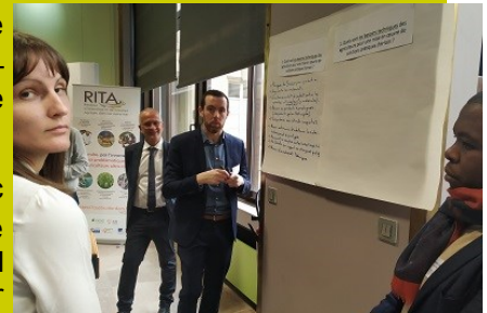
Journées techniques lors du salon de l'agriculture 2020 dans le cadre du projet TransAgriDom qui réunit toutes les structures agricoles des DOM autour de sujets sur la transition agro-écologique.

Chantiers en cours Côté RR976 proprement dit, nous poursuivons nos travaux avec la participation à de nouveaux chantiers qui ont chacun leur importance à l'échelle de l'île. En premier, l'organisation des EGA- Etats généraux de l'Agriculture-lancés par M le Préfet, en parallèle d'autres consultations agricoles, telles les ateliers prospectifs sur la place de l'agriculture de l'île en 2035 dans le cadre de LESELAM 2 conduit par le BRGM, ainsi que les rencontres animées par le cabinet VERSO pour définir les orientations stratégiques agricoles de Mayotte par le Conseil départemental.