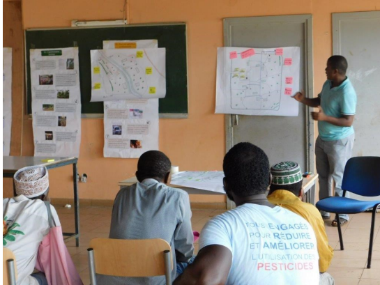
Ateliers d'agriculteurs de Bandrani, bassin versant pilote du projet. Au total 45 personnes ont participé aux débats.

L'agriculture mahoraise évolue très rapidement, pouvant induire une détérioration des ressources naturelles et l'érosion des sols. Afin de prévoir l'évolution de cette érosion, le projet LESELAM a engagé une prospective agricole, fondée sur trois scénarios contrastés d'évolution de l'occupation du sol en zone agricole. Ces scénarios décrivent de manière narrative des trajectoires possibles de l'agriculture à Mayotte à l'horizon 2035, ils ont été mis en débat au sein de 5 groupes de travail, réunissant des agriculteurs, des représentants syndicaux, des conseillers agricoles et des acteurs institutionnels. Les résultats de ces ateliers ont été restitués fin février 2020.