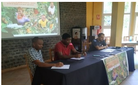
Conférence de presse pour lancer la campagne de communication sur le foncier agricole, menée par le PAI et les JA, en partenariat avec l'Etablissement Public Foncier d'Aménagement de Mayotte, le Réseau Rural, la CAPAM et le CD.