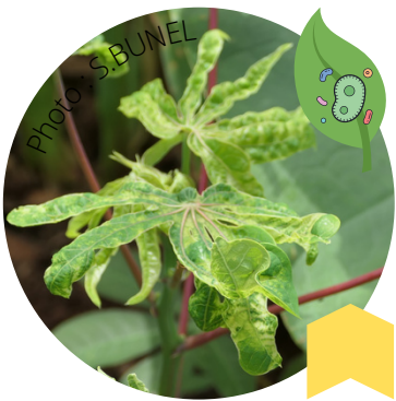
Virus de la mosaïc - CMV