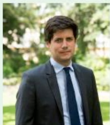
Julien Denormandie, ministre de l'Agriculture et de l'Alimentation

« Un tel recensement est indispensable pour relever les défis qui nous attendent. Nous avons besoin de recueillir des données précises pour observer les mutations des systèmes agricoles français, mesurer l'importance de notre agriculture française au sein de l'Union européenne et déployer toutes les mesures nécessaires pour préparer l'agriculture de demain.